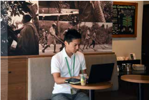
モバイル環境でのセキュリティ確保にも有効

NBI 様が 2 要素認証製品の取り扱いについて検討を開始したのは、昨今のセキュリティ環境の深刻化をうけ、今後は企業システムやクラウドサービスなどで 2 要素認証が必須となることを見越してのことでした。また NBI 様