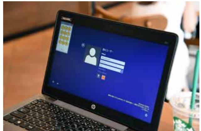
Windows のログオン画面に PINpad を表示

としても営業担当者が外出するシーンが多く、外出先からよりセキュアに利用できる運用が必要だと考えたことも背景にあります。