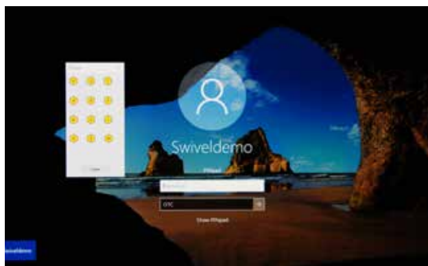
Windows10 のログオン画面に PINpad を表示

当初の計画では、外出の機会が多い社員を手始めにユーザを拡大していく計画でしたが、社内各所から「働き方改革」の一環としてユーザの拡大を検討してほしいという話があり、今後はデスクトップ PC への Windows Logon を含め、全社員に適用する方向で検討が進んでいます。